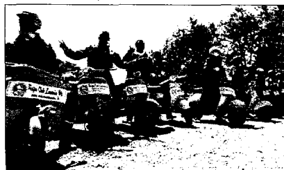
Un momento di un raduno del Vespa Club

Nei giorni scorsi infatti, sono cominciate le riprese del Vespa Club Lucania, primo club vespa in Basilicata, per il documentario che vedrà coinvolti i sei paesi della Valle del Noce (Nemoli, Rivello, Trechina, Lagonegro, Maratea, Lauria).